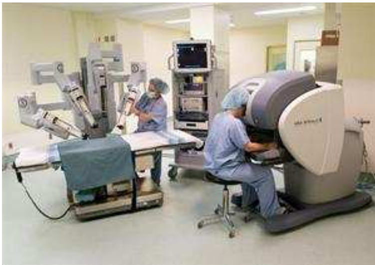
Figure 1: Système da Vinci à quatre bras avec télémanipulateur, colonne technique et console de

Un système de chirurgie assistée par robot de la marque da Vinci consiste en une console de travail (une deuxième est en option et permet le partage et la formation des jeunes chirurgiens), une colonne technique comportant la vidéo, l'éclairage, l'unité d'électrochirurgie et l'injection de dioxyde de carbone, ainsi que le télémanipulateur doté de quatre bras porte-instrument qui sera placé à proximité du patient. Le